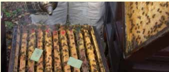
Die Behandlung mit Thymol dauert 6 Wochen. Die Dosierung erfolgt nach dem Prinzip »1+1«. Nach zwei Wochen die zweite Dosis zur ersten geben!

In Ausnahmefällen bei ungünstigen Standortbedingungen kann im Rahmen des Therapienotstandes Ameisensäure 85% in DAB-Qualität eingesetzt werden (Rezept des Tierarztes erforderlich, Bezug über Apotheken, siehe www.bienenkunde.uni-hohenheim.de ).