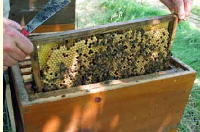
Baurahmen ans Brutnest hängen, nie an den Rand der Zarge! Bei zweizargigen Völkern in die obere Zarge. Drohnenbrut des Baurahmens niemals schlüpfen lassen!

Die Entnahme von verdeckelten Drohnenwaben im Frühjahr bremst die Befallsentwicklung bis zum Sommer. Schon wenige entfernte Milben können Schäden im Herbst verhindern.